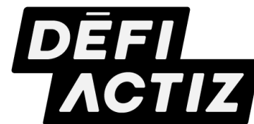
TABLEAU DES POINTS LUDO

Les points s'ajustent selon votre intensité!